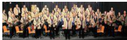
Die Musikkapelle Lippertsreute ist Ausrichter des Verbandsmusikfestes an Pfingsten.

Bodenseekreis – Der Musikverein „Harmonie“ Lippertsreute feiert „150 Jahre Musikkapelle“ und geht das ganz groß an.